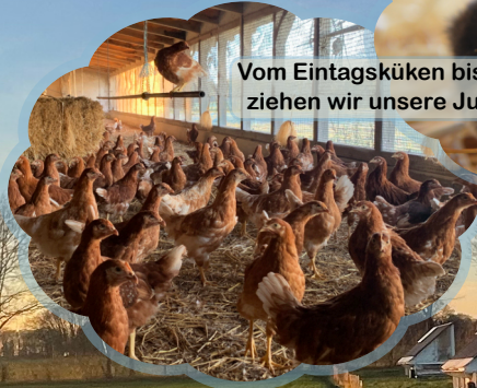
Vom Eintagsküken bis zur 17. Woche ziehen wir unsere Junghennen auf.