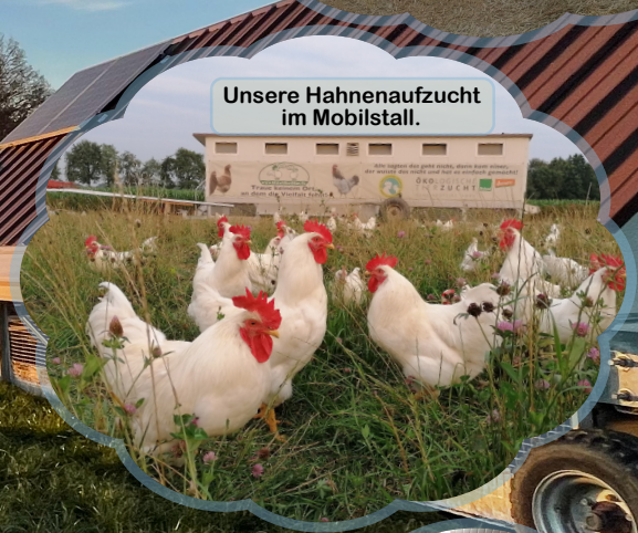
Unsere Hahnenaufzucht im Mobilstall.