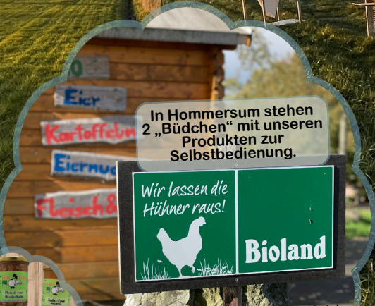
In Hommersum stehen 2 „Büdchen“ mit unseren Produkten zur Selbstbedienung.