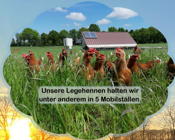
Unsere Legehennen halten wir unter anderem in 5 Mobilställen.