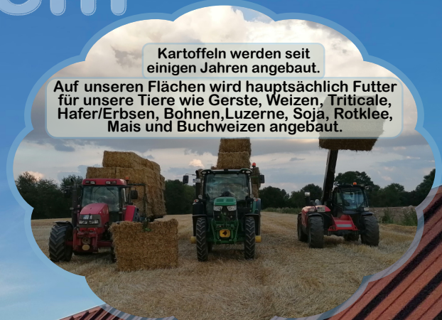
Kartoffeln werden seit einigen Jahren angebaut. Auf unseren Flächen wird hauptsächlich Futter für unsere Tiere wie Gerste, Weizen, Triticale, Hafer/Erbsen, Bohnen, Luzerne, Soja, Rotklee, Mais und Buchweizen angebaut.